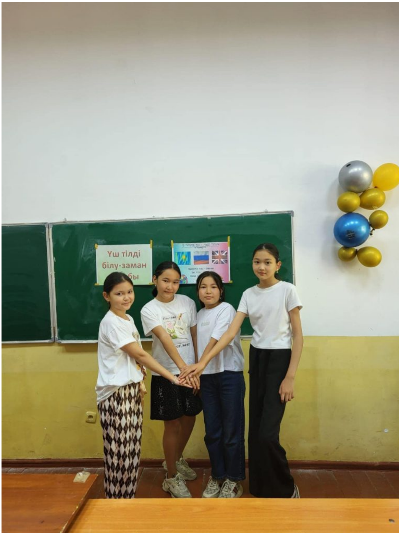
«Үш тілді білу-заман талабы» атты ағылшын тілі сабағы